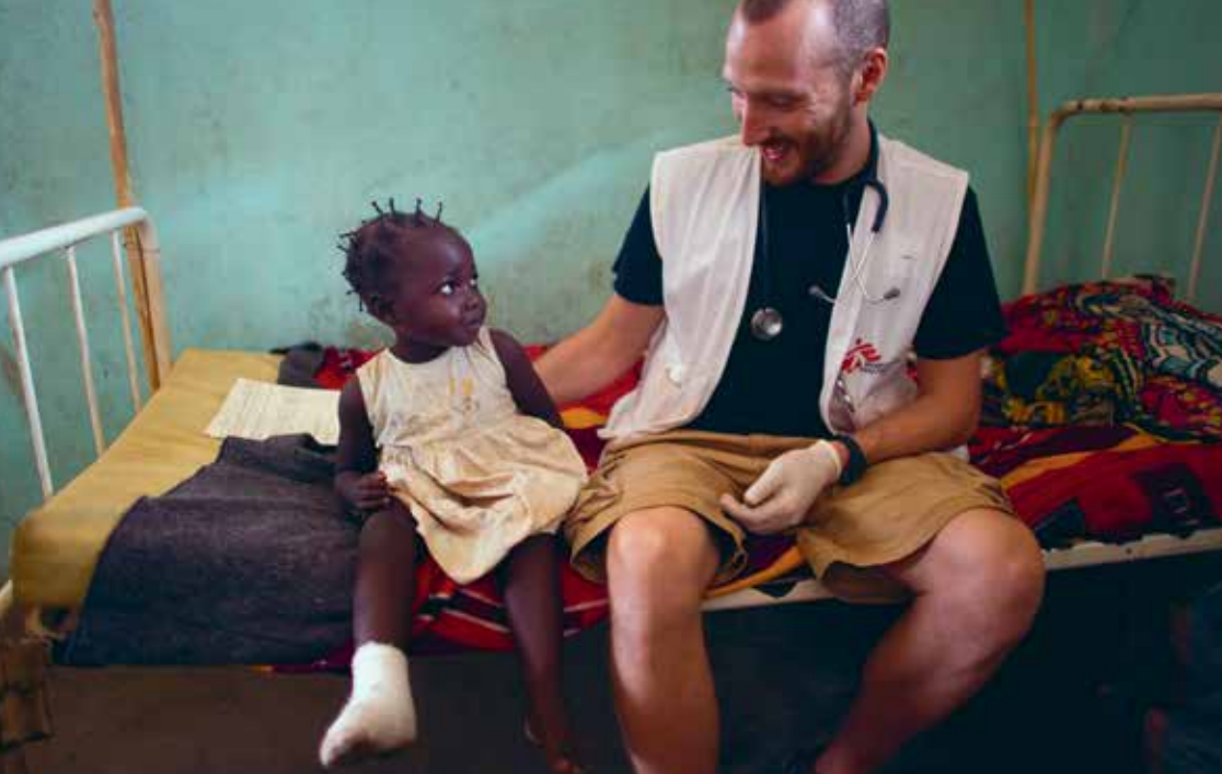
En af vores læger tilser en lille pige, som er kommet til skade med sin fod, på hospitalet i Bangui.