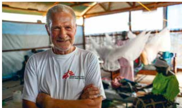
En af vores kirurger på arbejde i Sydsudan, hvor han hjalp til med at udføre de yderst komplicerede fistula-operationer. Fistula er en lidelse, der kan ramme kvinder i forbindelse med komplicerede og langvarige fødsler eller grove voldtægter, hvor der opstår et hul mellem skeden og blæren eller skeden og endetarmen.

til nødhjælp maksimalt. Vores udsendte læger, sygeplejersker og logistikere får 12.236,50 kr. i månedsløn til at dække faste udgifter hjemme, første gang de er udsendt.